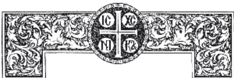
الجزء الثاني (بالحن الخامس)

+ إِنَّا بِاسْتِحْقَاقٍ . نَعْلَمُكَ يَا وَاهِبَ الْحَيَاةِ . يَا مَنْ بَسَطَ يَدَيْهِ عَلَى