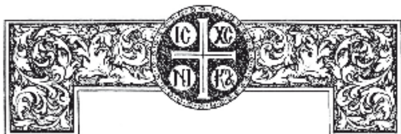
الجزء الثاني (بالحن الخامس)

+ إِنَّا بِاسْتِحْقَاقٍ . نَعْلَمُكَ يَا وَاهِبَ الْحَيَاةِ . يَا مَنْ بَسَطَ يَدَيْهِ عَلَى الصَّلِيبِ . فَعَدَا سَاجِدًا قُوَّةَ الْعَدُوِّ .